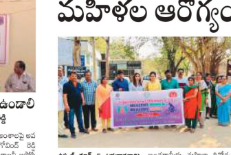
మహిళల ఆరోగ్యంపై అవగాహన కార్యక్రమం

అందరినీ సుదీర్ఘ వేరక భవనం పాత్ర వేయడం అంశాలపై ప్రజాస్వామ్య ఉద్యమాన్ని ప్రోత్సహించాలి. అందరూ కలిసి, ఒకటే ఛార్జింగ్ ఉద్యమాన్ని ప్రారంభించాలి.