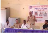
సామాజిక అంశాలపై అవగాహన ఉండాలి